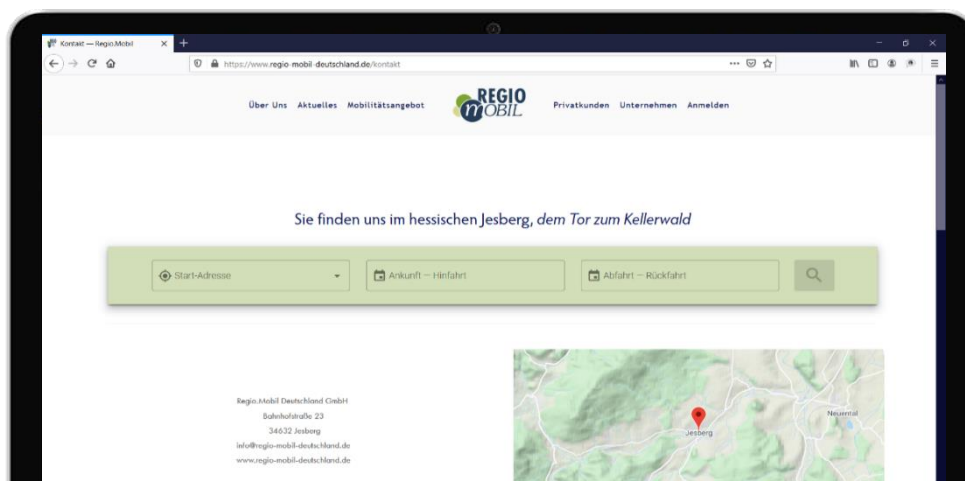
Widget-Integration auf der Regio.Mobil Website

Mit CleverRoute dynamisieren Sie die herkömmliche, statische Anfahrtsbeschreibung auf Ihrer Homepage. Ihre KundenInnen und BesucherInnen finden somit nicht nur Infos zur Mobilität auf der letzten Meile, sondern vom Abfahrtsort bis zu Ihnen. Mit der hohen Transparenz machen Sie Ihnen die Nutzung der in Ihrer Stadt verfügbaren Nahmobilitätsalternativen besonders einfach. Nutzen Sie das praktische Widget, um BesucherInnen Ihrer Webseite schnell und einfach den Service von CleverRoute anzubieten. Für Ihre Unternehmensmitglieder lässt sich das Widget ebenfalls verwenden und sorgt somit für eine breite Verwendung von CleverRoute in Ihrer Region.