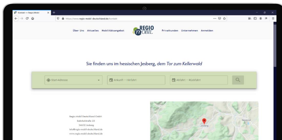
Beispiel: Widget-Integration auf der Regio.Mobil Website

Für Ihre MieterInnen ermöglicht CleverRoute damit eine vollumfängliche Übersicht über die Erreichbarkeit verschiedenster POI (Zieladressen) ausgehend vom Standort Ihrer Immobilie. So helfen Sie ortsunkundigen MieterInnen, sich schnell in der neuen Umgebung zu orientieren. Dabei können die MieterInnen auf verschiedene Verkehrsmittel sowie deren Kombination zurückgreifen, erhalten vollumfängliche Informationen zu CO 2 -Emissionen, Kosten, Zeit und körperlicher Bewegung und können die jeweiligen Verkehrsmittel über die Weiterleitung zur Anbieterplattform direkt buchen.