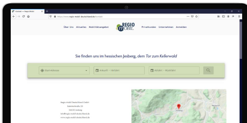
Widget-Integration auf der Regio.Mobil Website

Mit CleverRoute dynamisieren Sie die herkömmliche, statische Anfahrtsbeschreibung auf Ihrer Homepage. Ihre Veranstaltungsteilnehmenden finden somit nicht nur Infos zur Mobilität auf der letzten Meile, sondern vom Abfahrtsort bis zu Ihnen. Mit der hohen Transparenz machen Sie Ihnen die Nutzung der in Ihrer Stadt verfügbaren Nahmobilitätsalternativen besonders einfach. Nutzen Sie das praktische Widget, um BesucherInnen Ihrer Webseite schnell und einfach den Service von CleverRoute anzubieten. Für Ihre Unternehmensmitglieder lässt sich das Widget ebenfalls verwenden und sorgt somit für eine breite Verwendung von CleverRoute in Ihrer Region.